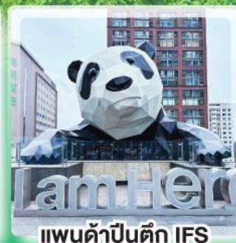
แพนด้าปิ่นตัก IFS