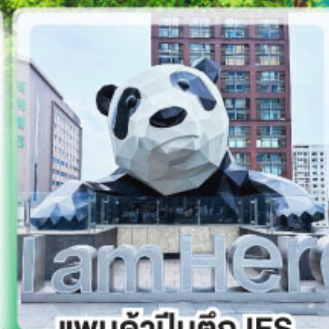
แพนด้าป็นตึก IFS