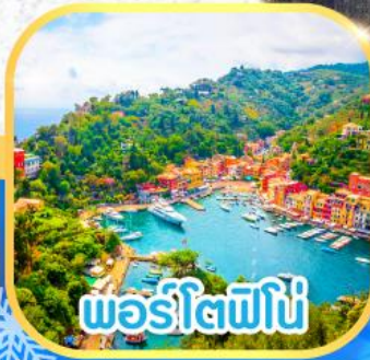
พอร์ตโอฟินโญ่