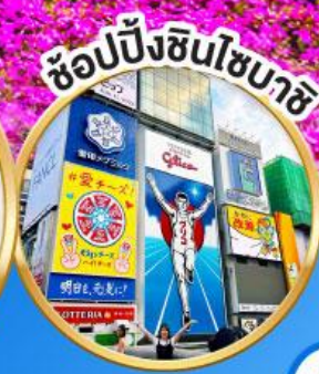
ช้อปปิ้งชินโซบาช