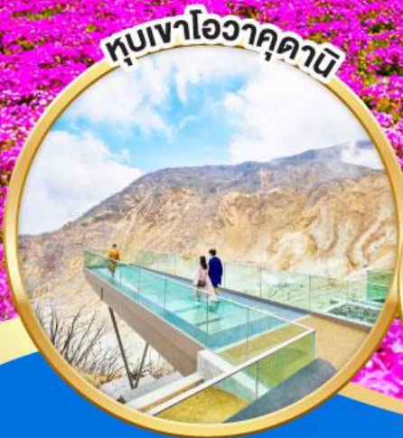
หุบเขาโอวาคุดานิ