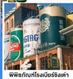
พิพิธภัณฑ์โรงเบียร์ซิงเต่า