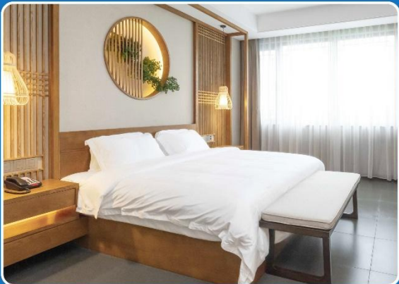
👤👤 DOUBLE (DBL)