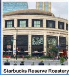
Starbucks Reserve Roastery