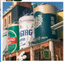
พรรกภัตที่โรงแรมเบียร์ชิงเต่า