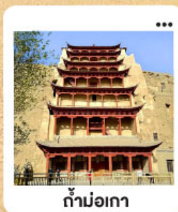
ถ้ำม่อเกา