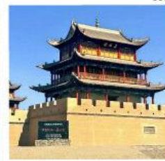
ถ้ำแพงเจียยี่กวน