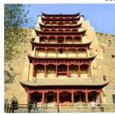
ถ้ำม่อเกา