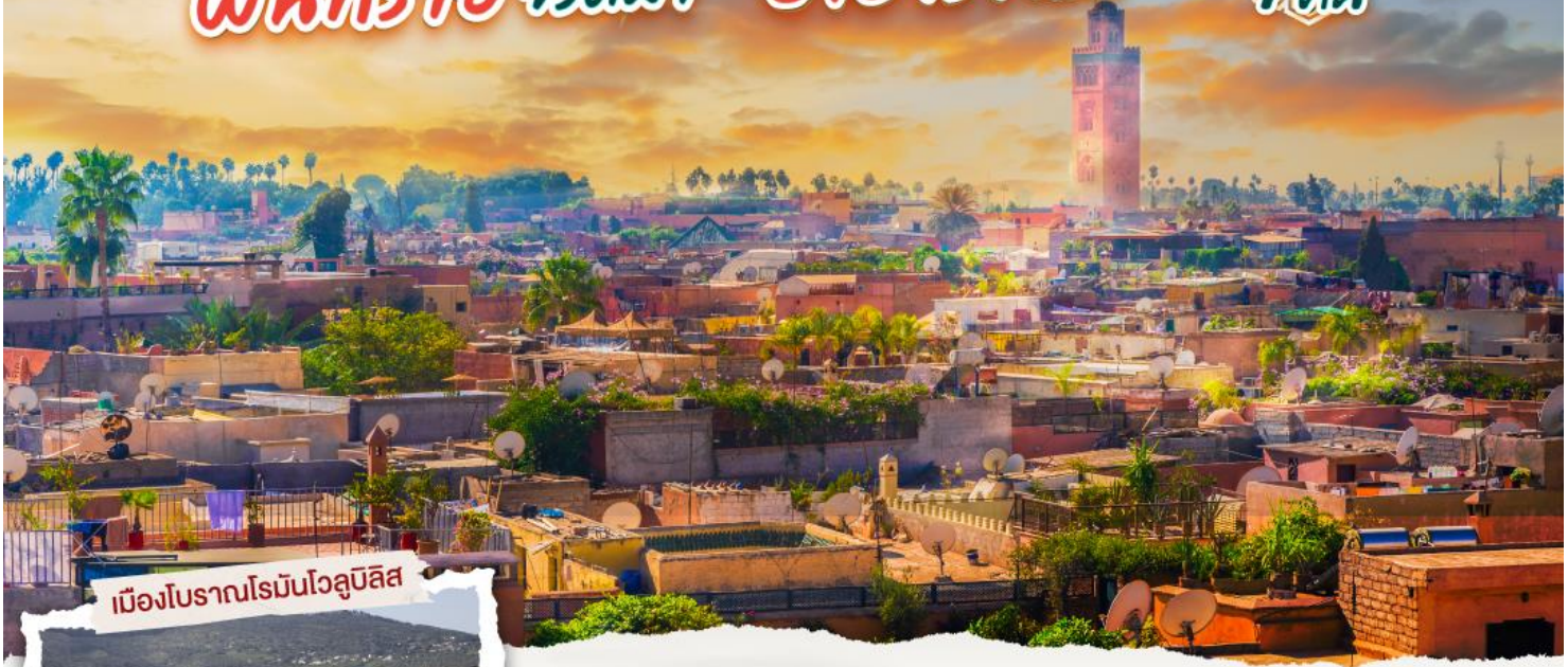
เมืองโบราณโรมันโวลูบิลิส