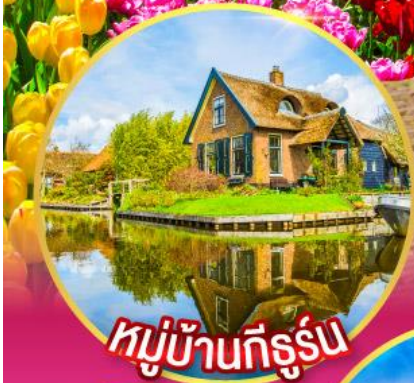
หมู่บ้านที่รัฐน