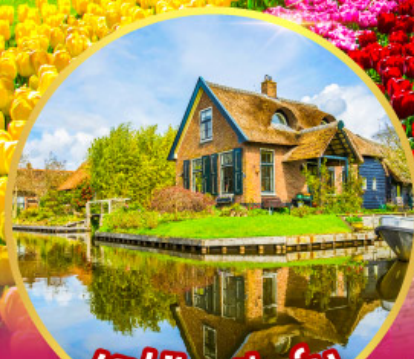
หมู่บ้านที่รูรัน