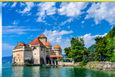
ปราสาทชิลอง