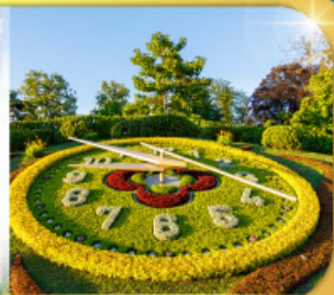
นาฬิกาดอกไม้เมืองเจนีวา