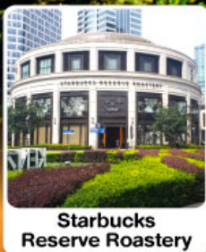
Starbucks Reserve Roastery