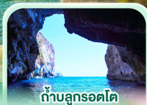
ถ้ำบลูกรอตโต