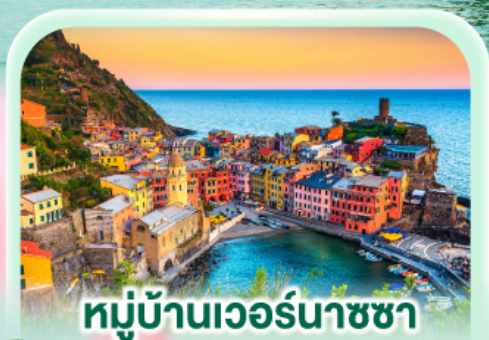
หมู่บ้านเวอร์นาซซา