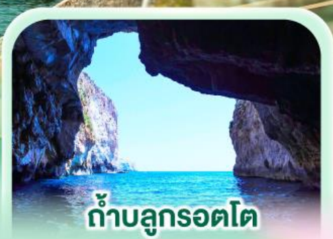
ถ้ำบลูกรอตโต