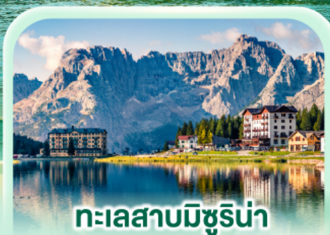
ทะเลสาบมิซูรีน่า