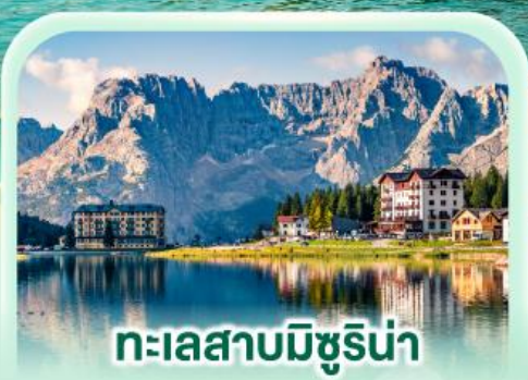
ทะเลสาบมิซูรีน่า