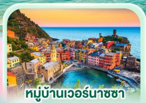
หมู่บ้านเวอร์นาชซา