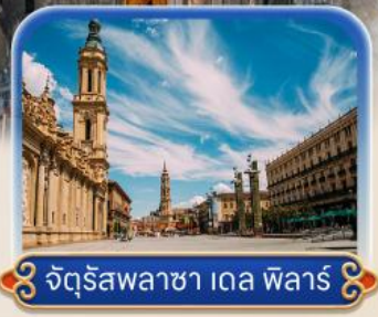
จัตุรัสพลาซ่า เดล ฟัลส์