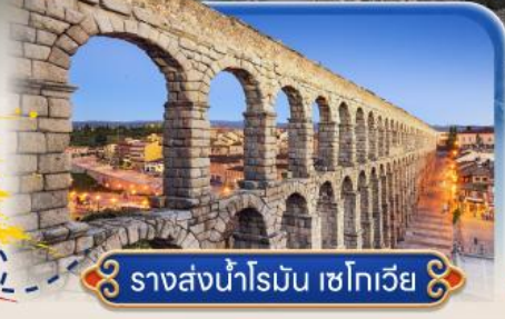
รางส่งน้ำโรมัน เซโกเวีย