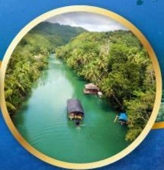
ส่องเรือแม่น้ำโลบ็อก