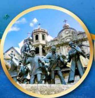
อนุสาวรีย์มรดกแห่งเซบู