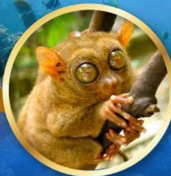
ลิงทาร์เซีย