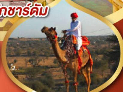
ฟรี ขี่อูฐ เมืองมันทวา ราคาเริ่มต้น