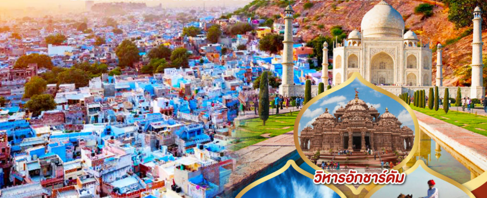
วิหารอักซาร์คัม