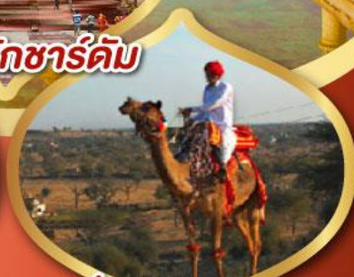
ฟรี ขี่อูฐ เมืองมันทอวา ราคาเริ่มต้น