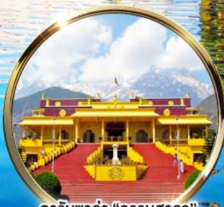
ดาริมซาล่า "ธรรมศาลา" ตำหนักองค์ดาไลลามะ