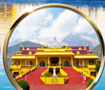
ดาริมซาล่า "ธรรมศาลา" ตำหนักองค์ดาโลลามะ