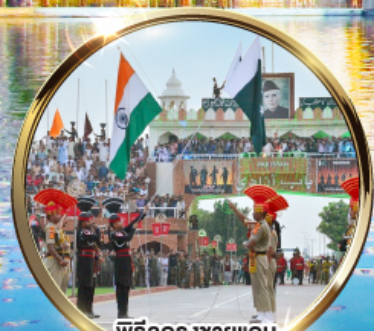
พิธีลดธงชาติ อินเดีย-ปากีสถาน ด้านวากาห์