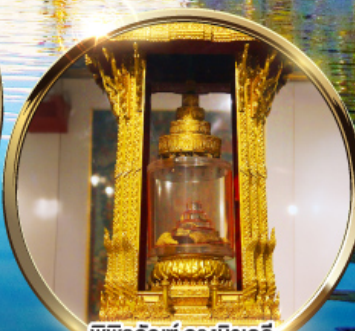
พิพิธภัณฑ์ กรุงนิวเดลี กราบมัสการพระบรมสารีริกธาตุ