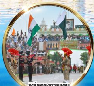
พิธีลดธงชัยแดน อินเดีย-ปากีสถาน ผ่านวากาห์

บินภายในไป-กลับ DEL ATO IXC DEL นั่งรถไฟไม่เหนื่อย