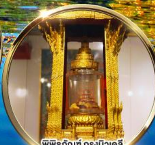
พิพิธภัณฑ์ กรุงนิวเดลี กราบมัสการพระบรมสารีริกธาตุ