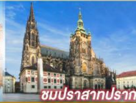
ชมปราสาทปราท