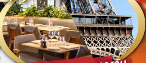
รับประทานอาหารกลางวัน บนหอคอยเฟล