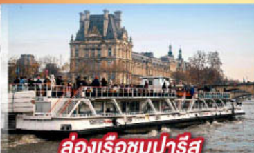
ล่องเรือชมปารีส