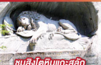
ชมสิงโตหินแกะสลัก