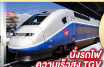
นั่งรถไฟ ความเร็วสูง TGV