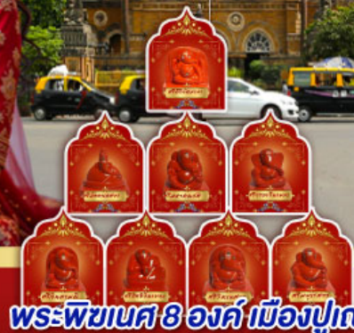
พระพิฆเนศ 8 องค์ เมืองปูणे

" อินเดียครั้งนี้ ไม่ใช่แคกรี๊ป แต่คือการเปลี่ยนแปลง ปลุกพลังในตัวคุณ... ด้วยพิธีกรรมศักดิ์สิทธิ์ ณ สถานที่จริง ของพระพิฆเนศ ดินแดนแห่งปัญญาและพรสูงสุด"