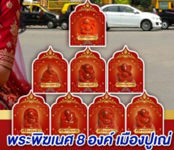
พระพิฆเนศ 8 องค์ เมืองปูणे