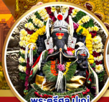
พระตรีศูล ปูणे (Trishul Pune)