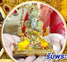
รับพระพิฆเนศวร ปางรำรอย ท่านละ 1 องค์