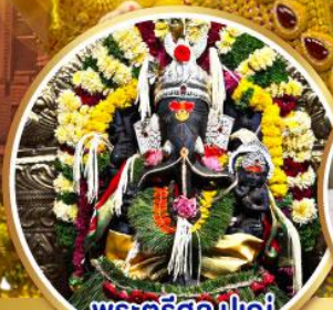
พระศรีศิว ปูणे (Trishul Pune)