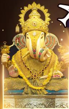
องค์ดีกษุทีพิเศษ