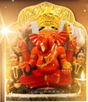
องค์สิทธินายก