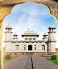
ทัชมาฮาลน้อย