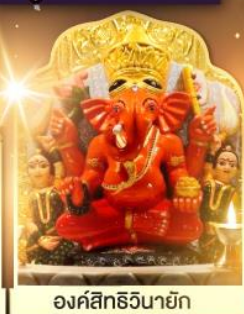
องค์สิทธินายิก