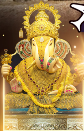
องค์ดีกษุทีพิเศษ