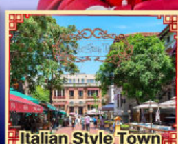
Italian Style Town