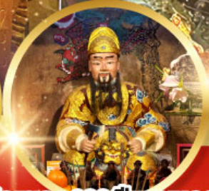
วัดแซกง 600 ปี หุ่นหลอง

ขอพรความสำเร็จ การงาน ขอพรความสำเร็จในชีวิตการงาน