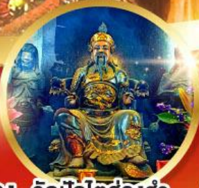
วัดปักไต้ฮ้องฮ่า