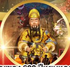
วัดแซก 600 ปี หุ่นหลง