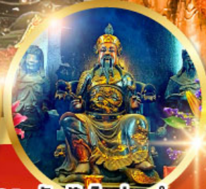
วัดปักไต้ฮ้องอำ

ขอพรความสำเร็จ การงาน ขอพรความสำเร็จในชีวิตการงาน