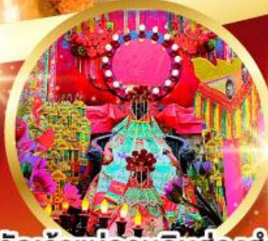
วัดเจ้าแม่กวนอิมฮ้องฮ่า