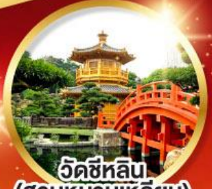
วัดซีหลิน (สวนหนานเหลียน)