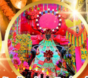
วัดเจ้าแม่กวนอิมฮ้องอำ (สวนหนานหลิน)