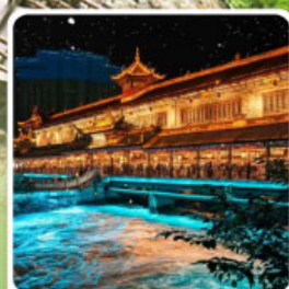
Blue Tears สะพานหนานเฉียว