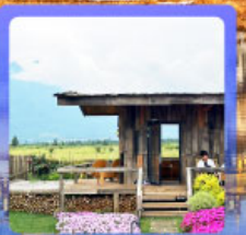
ร้านกาแฟหุบเขาคี๊อัน