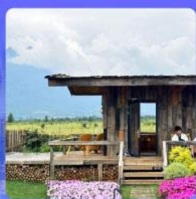
ร้านกาแฟหยุนตัน