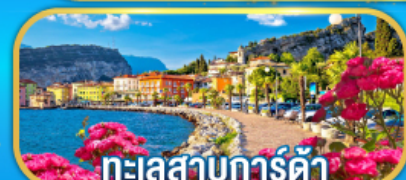
ทะเลสาบการ์ดา