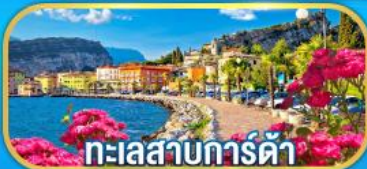
ทะเลสาบการ์ดี