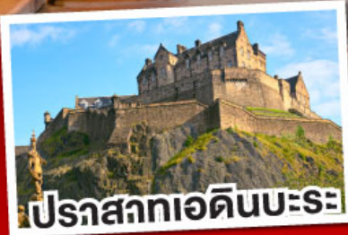
ปราสาทเอดินบะระ