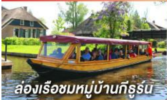
ล่องเรือชมหมู่บ้านกิธูร์น