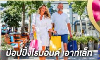
ป๊อปป์ปิงโรมอนด์ ไอาก์เล็ก