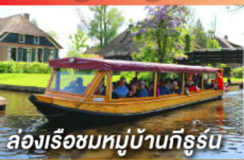
ล่องเรือชมหมู่บ้านกังธูร์น

สุดพิเศษ กับสวนดอกทิวลิป ที่จัดเพียงปีละหนึ่งครั้ง