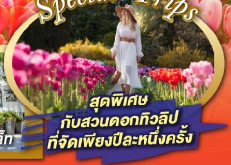
สุดพิเศษ กับสวนดอกทิวลิป ที่จัดเพียงปีละหนึ่งครั้ง