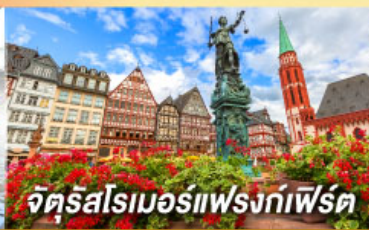
จัตุรัสโรเมอร์เฟรงก์เฟิร์ต