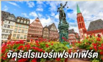
จัตุรัสโรเมอร์เฟรงก์เฟิร์ต