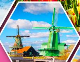
หมู่บ้านกังหันลม ชาสคินส์