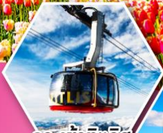
กระเช้าทีตลิส