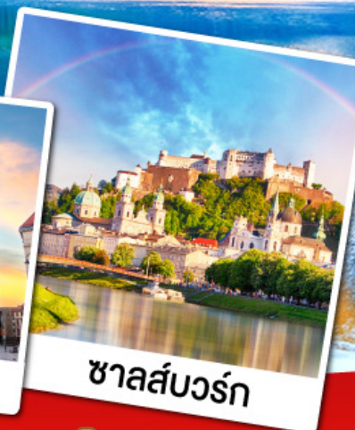
ชาลส์บวร์ก