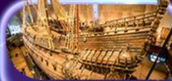
พิพิธภัณฑ์ทว่าซา