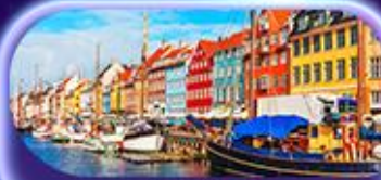
ย่านนูฮาวน์

ย่านดิงย่านนูฮาวน์ ซ็อบบิงเฮสปลานาติ ถนนคนเดิน Stroget