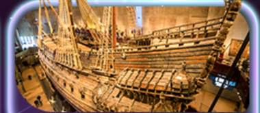
พิพิธภัณฑ์เรือ

เยือนคาบสมุทรสแกนดิเนเวีย ดินแดนแห่งยุโรปเหนือ ชมความงามสไตน์ออร์ติกสุดมหัศจรรย์ สถาปัตยกรรม โบสถ์เก่าเพสซิวคิโอ อาสนวิหารออสเพนสกี อนุสาวรีย์ซีเบลียส พักดื่มพลาดจตุรัสวงศากาเฮลซิงกิ เยี่ยมชมพิพิธภัณฑ์เรือเก่า ศาลาว่าการสตอกโฮล์ม ย่านเมืองเก่า Gamla Stan ถ่ายภาพ Oslo Opera House สวนมนุษย์ชาติ Vigeland ป้อมปราการอาครัสฮูส มหาวิหารออสโล เซ็กซ์เลนคัมมาร์คน้ำพุเทพีออน รูปปั้นนางเงือก พระราชวังมาเลียนบอร์ก พระราชวังคริสเตียนบอร์ก ย่านดิงย่านนูฮาวน์ ซุปป์ิงเอสplanชาติ ถนนคนเดิน Strøget