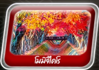
มิมิจิไคริ

สายการบิน AirAsia X (XJ) น้ำหนักกระเป๋า 20 KG