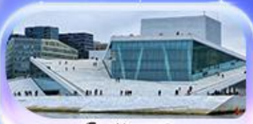
โอเปร่าเฮาส์

07-15 ต.ค.69 / 16-24 ต.ค.69 13-21 พ.ย. 69 / 04-12 ธ.ค. 69 25 ธ.ค. 69 - 02 ม.ค. 70 (ปีใหม่)