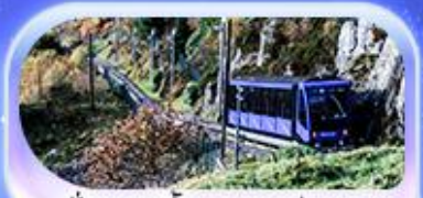
นั่งรถรางขึ้นยอดเขาฟลอยอน

เปิดประสบการณ์สุดจ้าว... สักครั้งในชีวิต! ล่องเรือชมฟยอร์ด