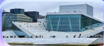
โอเปร่าเฮาส์

07-15 ต.ค.69 / 16-24 ต.ค.69 13-21 พ.ย. 69 / 04-12 ธ.ค. 69 25 ธ.ค. 69 - 02 ม.ค. 70 (ปีใหม่)