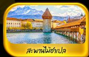
สะพานไมชาเปลา