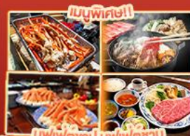
บุฟเฟ่ต์ญี่ปุ่น บิงข่างยากิโทโกอิน Steakland Kobe