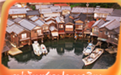
หมู่บ้านชาวประมงอิเะ