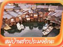
หมู่บ้านชาวประมงอิเกะ