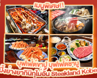
บุฟเฟ่ต์ญี่ปุ่นบุฟเฟ่ต์ซาบู ปิ้งย่างยากิnikuในร้าน Steakland Kobe