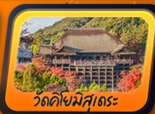
วัดคิโยมิสุเดระ