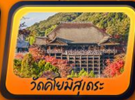
วัดคิโยมิสุเดระ

พัคฟูจิออนเซ็น 1 คืน กิฟู 1 คืน โทยาม่า 1 คืน นาริตะ 1 คืน