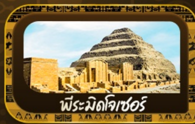
พีระมิดโจเซอร์