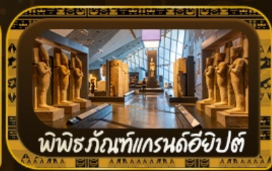
พีพีธร์กัทท์แกรนด์อียิปต์