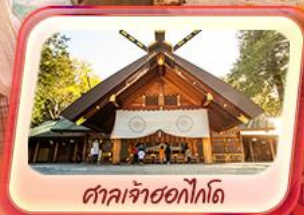
ศาลเจ้าซอกโกโต