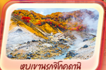
เขมเขานรกจิโศดานิ