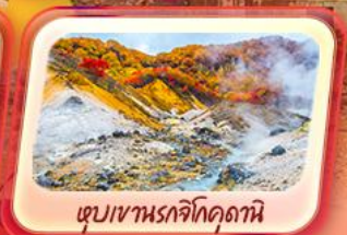
เขมเขานรจิกูดานิ