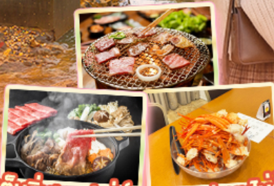
เต็มอิ่ม! บุฟเฟ่ต์ ซาบู+ชาปูแบบไม่อัน ปิ้งย่าง Yakniku Buffet

สายการบิน AirAsia X (XJ) น้ำหนักกระเป๋า 20 KG