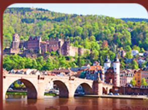
ชมเมืองสวย ไรเดิลเบิร์ก