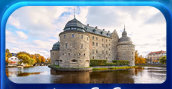
ปราสาทไอเรโบ