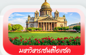
มหาวิหารเซนต์ไอแซค