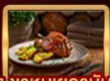
เมนูพิเศษ!! Ribs of Vienna, ปลาเทราสย่าง, จาหมุยเออร์มิน