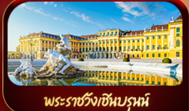
พระราชวังเซินบรูน์

ฟรีด 29 พ.ค.-05 มิ.ย.69 / 02-19 มิ.ย.69 / 21-28 ก.ค. 69 05-12 ส.ค. 69 / 16-23 ก.ย.69