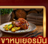
Ribs of Vienna, ปลาเทราศย่าง, อาหารหมูเยอรมัน