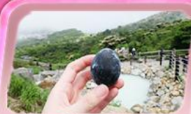
โอะวาคุดานิ

ชมสีชมพูผืนใหญ่ที่ฐานฟูจิซัง! เทศกาลซิบะซากุระ: 1 ปีมีครั้งเดียว เปิดประสบการณ์ล่องเรือโจรสลัด ตะลุยหุบเขาโอะวาคุดานิ ซิมโงะค้ำ "Unseen" ชมพรต้วยหัวโซเทเกะ ที่วัดมิตสึสึยาม่า โซเด็น ช้อปปิ้งจัดเต็มย่านคังชินจูกุ และ Gotemba Outlet