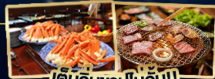
เต็มอิ่มทุกมื้อ!! และบ๊วย่างสไตล์ญี่ปุ่น

สัมผัสความยิ่งใหญ่ กำแพงหิมะ เทือกเขาเอลปป์ญี่ปุ่น ต้มตุ๋นธรรมชาติของคามิโคจิ เช็คอินที่หมู่บ้านชิราคาวาโกะ ชมฟูจิฤดูใบไม้ผลิ ไอชิซิวาร์ค ชมทุ่งชิบะซากุระ ศาลเจ้าฟูชิมิ อินาริ ถนนซาเบียวจูกิ เยือนปราสาทโอสากา ซอปปิงย่านชินไซบาชิและอาซากุสึ