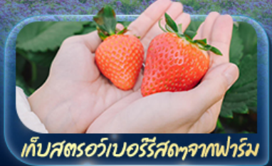
เก็บสตอร์วเบอร์รี่สดจากฟาร์ม