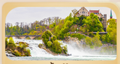
น้ำตกโรน

เที่ยวสวิทเซอร์แลนด์ สวรรค์แห่งนักผจญภัย พิชิตยอดเขา Grindelwald First และ Jungfrau ไม่พลาดเมืองดังลูเซิร์น ซูริค อินเทอร์ลาเคน ชุก กรุงเบิร์น เพลินตากับความงดงาม สะพานไม้ชาเปล สิงโตแกะสลัก นาฬิกา ไซท์ กล็อคเค์ ไลน์สโตนเฮาส์ ชมความน่ารักป้อมหมีสีน้ำตาล พลังน้ำที่ยิ่งใหญ่ที่สุดในยุโรป! น้ำตกโรน! ซ็อบบิงถนบนบารันโอฟชตราเซอร์