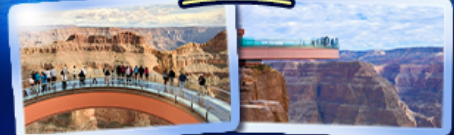
ชมความยิ่งใหญ่ของ GRAND CANYON WEST SKYWALK