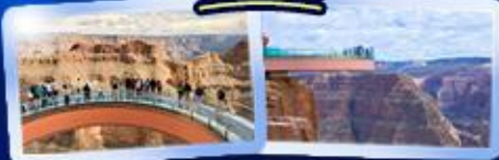
ชมความยิ่งใหญ่ของ GRAND CANYON WEST SKYWALK