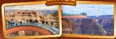
ชมความยิ่งใหญ่ของ GRAND CANYON WEST SKYWALK