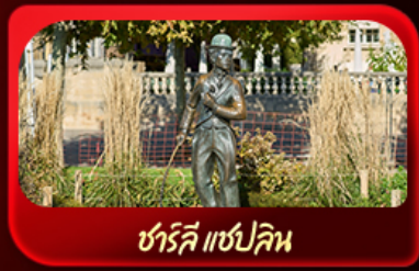
ชาร์ลี แชปลิน