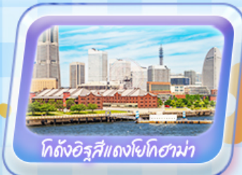
โดคังอิซึสึแดงโยโกฮาม่า