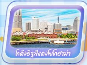
โกดังอิฐสีแดงโยโกฮาม่า