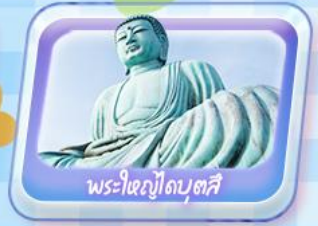
พระใหญ่อุโบสถ์