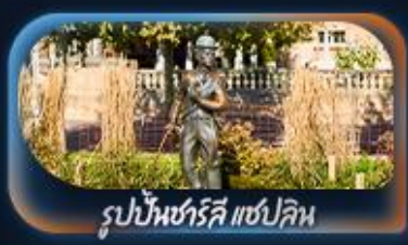
รูปปั้นชาร์ลี แชปลิน

เที่ยวครบจบทุก Highlight ตะลุยจุงเฟรา วิวอลังการจิตเต็มสมชื่อ Top Of Europe สักครั้งในชีวิตหมู่บ้านเซอร์แมท นั่งรถไฟสาย Gornergrat bahn หมู่บ้านเลาเทอร์บรุนเนินสวยเหมือนเทพนิยาย เปิดประสบการณ์โรแมนติกล่องเรือทะเลสาบรุน ทะเลสาบเจนีวา น้ำพุจรวดเจ็ทโต ศาลาไทย รูปปั้นชาร์ลี แชปลิน The Fork ปราสาทชิลยอง หมู่บ้านอิซลทอวัลด์ สิงโตแกะสลัก สะพานไม้ชาเปล โบสถ์ฟรอมุนสเตอร์ ซ็อบป์นิงจุงเกนบนานไอฟพตราเซอร์