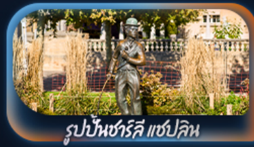
รูปปั้นชาร์ลี แชปลิน