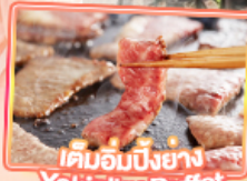
เค็มอบบิงย่าง Yakiniku Buffet