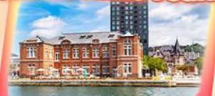
โมจิโกะ เรโทร