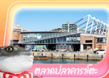
ตลาดปลาอาราโตะ