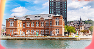
โมจิโกะ เรโทร