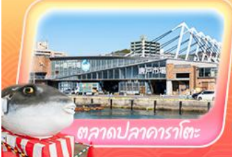
ตลาดปลาคาราโตะ

สัมผัสกลิ่นอายญี่ปุ่นแท้ที่ศาลเจ้าคาโซฟู จอพรวัดนินโซอิน เดินเล่นหมู่บ้านยูฟูอินสุดน่ารัก ชมวิวทะเลสาบคินริน ย้อนอดีตกับ โมจิโกะ เรโทร นั่งเรือเฟอร์รี่ เช็คอินตลาดปลาคาราโตะ ถ่ายภาพปราสาทโคคุระ ช้อปบิงจุใจที่ เอากะเล็คคิตะคิอู