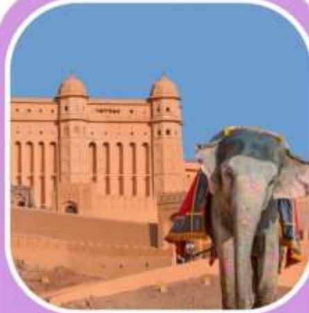
พระราชวัง แอมเบอร์ฟอर्ट