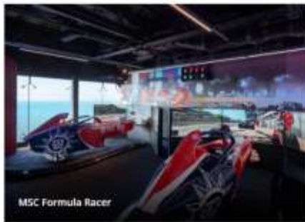
MSC Formula Racer